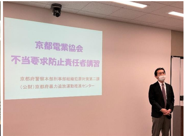
協会員向け 不当要求防止責任者講習