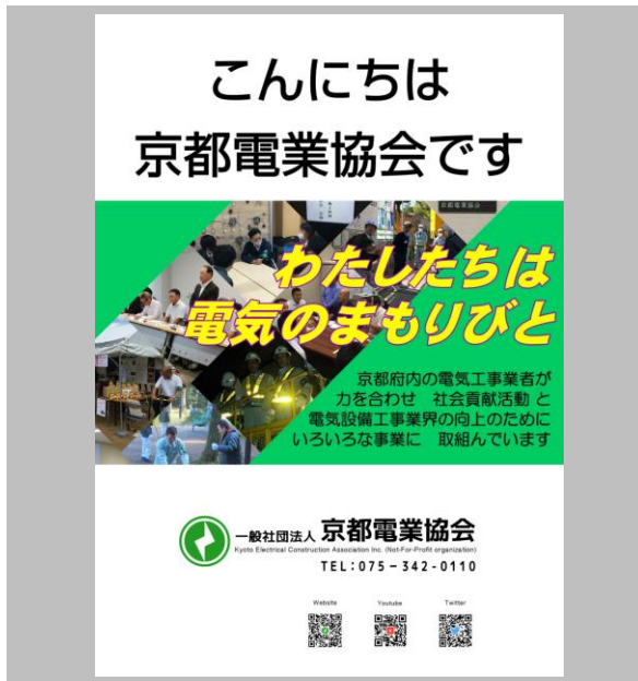
電気設備工事業界 P R 資料 (令和 3 年作成)