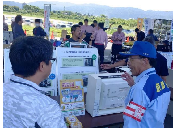
京都府総合防災訓練における防災啓発展示 出展状況