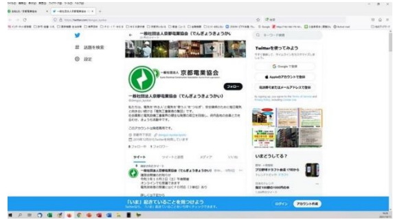
京都電業協会 SNS “X” (元 Twitter・令和元年開始)