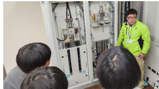
高校生対象・実技講習 & 建設現場見学会 (令和 5 年実施)