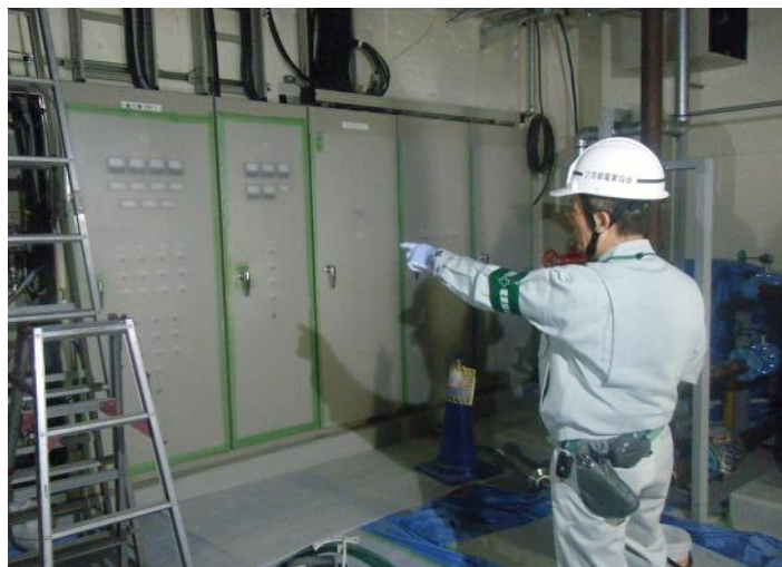
安全パトロール（平成年代に実施） 実施風景