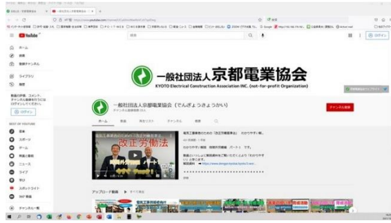
京都電業協会 Youtube チャンネル (令和2年開始)