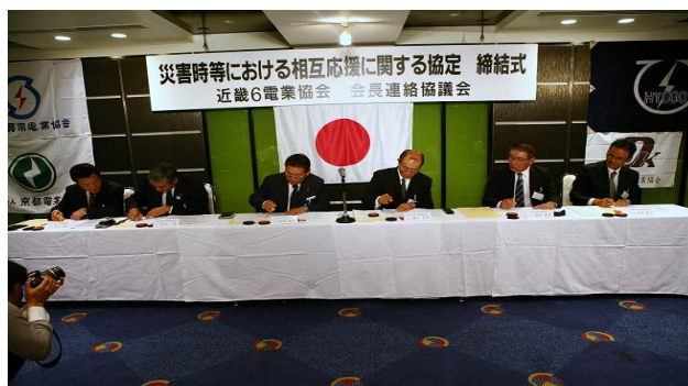
近畿6電業協会「災害時等における相互応援協定」締結式