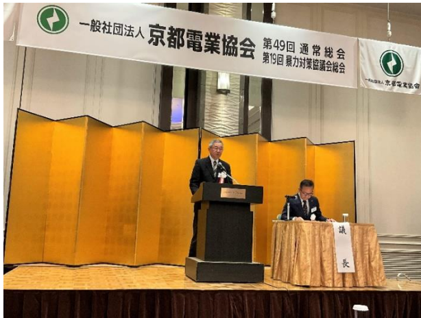
暴力対策協議会 総会